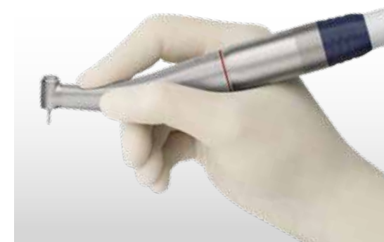
Diseño ergonómico para un trabajo sin fatiga.